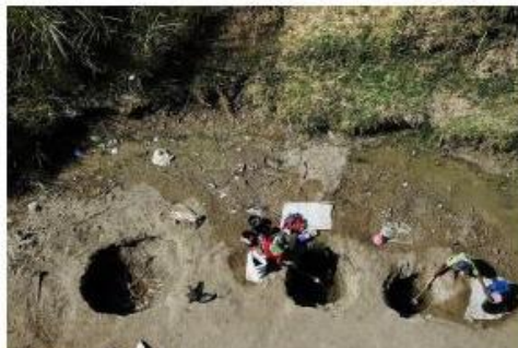
PEROKHEA 28 AGUSTUS Musim Hujan Bakal Terlambat

Jakarta, 28 Agustus 2018 - JKN adalah solusi jangka panjang untuk menutupi defisit kasangan BPJS Kesehatan. Namun, bantuan ini dinilai belum jangka pendek. Pemerintah perlu melakukan langkah-langkah lain untuk menutupi defisit kasangan BPJS Kesehatan.