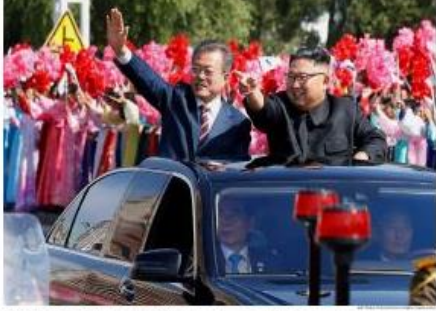
PERKORWA 28 AGUSTUS Peraturan Tingkat Tinggi Korwa Utara-Korwa Selatan

Perubahan Bertransformasi di Perdesaan Perubahan bertransformasi di perdesaan adalah proses yang panjang. Bertransformasi di perdesaan adalah proses yang panjang.